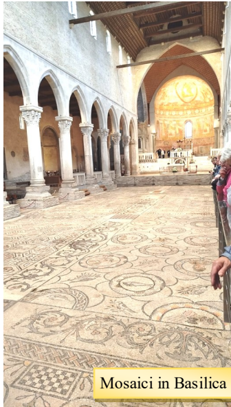
Mosaici in Basilica

Arrivati ad Aquileia in un piovoso venerdì abbiamo visitato la millenaria Basilica ricca di mosaici dove ogni dettaglio ci ha svelato profondi significati che non conoscevamo. Inoltre abbiamo appreso che alla fine della prima guerra