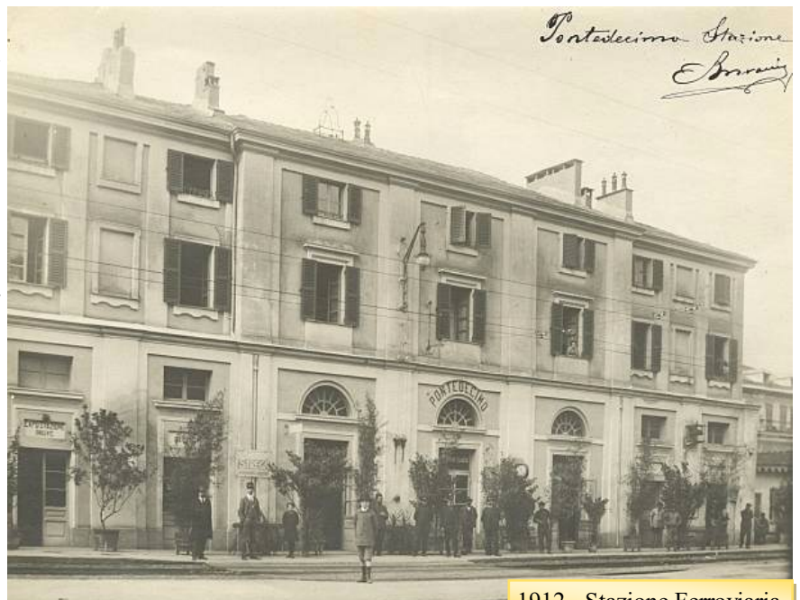
1912 - Stazione Ferroviaria