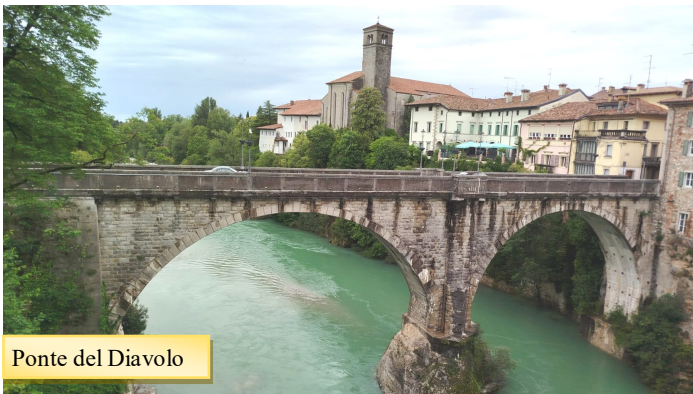
Ponte del Diavolo

Sabato mattino ci attendeva Cividale del Friuli con il suo fiume Natisone verde smeraldo e turchese che