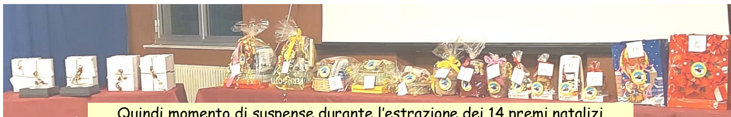
Quindi momento di suspense durante l'estrazione dei 14 premi natalizi

Una bella serata in compagnia, in "famiglia", ma con un velo di mestizia per il ricordo dei Soci che ultimamente ci hanno lasciato.