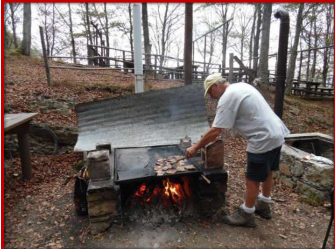
21 SETTEMBRE 2016